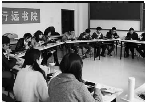
行遠書院師生開展團膳活動。