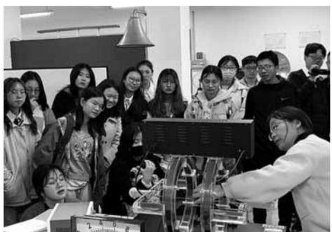
行遠書院學子在日喀則物理實驗課上。